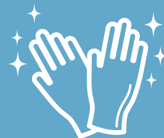
毎回のグローブ交換