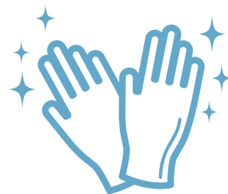
毎回のグローブ交換