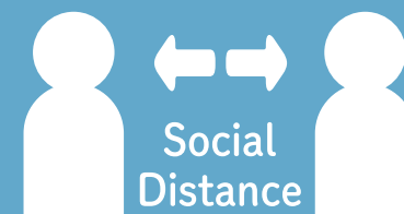
距離をとって対応