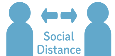
距離をとって対応